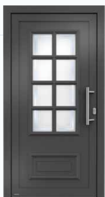
Modell H10878 Hinweis: Nur in Glasfalzfüllung erhältlich. Basisausstattung mit 2-fach Glas. Optional gegen Aufpreis 3-fach Verglasung.

Wir leben im Hier und Jetzt – und schätzen doch die Traditionen. Zu unserem Haus passt nur eine wertsteigernde Haustür im klassischen Stil. Mit eleganter und zeitloser Formensprache. Mit charakteristischen Gestaltungselementen wie Lichtausschnitten oder profilierten Zierleisten. Im Inneren neueste Technik, in der Erscheinung traditionelles Handwerk.